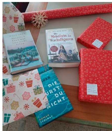
Bücher sind immer ein Geschenk, aber jetzt auch noch verpackt.