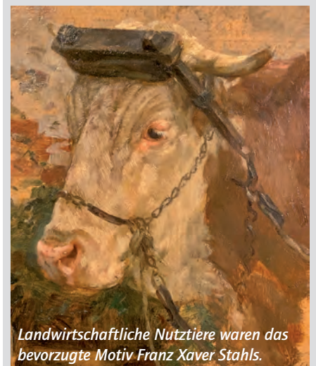
Landwirtschaftliche Nutztiere waren das bevorzugte Motiv Franz Xaver Stahls.

Das Museum Franz Xaver Stahl, einstiges Wohn- und Atelierhaus des 1901 in Erding geborenen Tiermalers Franz Xaver Stahl in der Landshuter Straße 31, hat am Sonntag, 7. November, von 14 bis 17 Uhr bei freiem Eintritt geöffnet. Die Ausstellungsräume im Erdgeschoss mit Tiergemälden von Johann Georg Schleich (1899-1952) lassen sich ohne Führung besichtigen. Im Obergeschoss sind die originalen Wohnräume geöffnet. Hier gibt es kurze Führungen in kleinen Gruppen. Der Besuch im Museum erfolgt nach der 3G-Regelung.