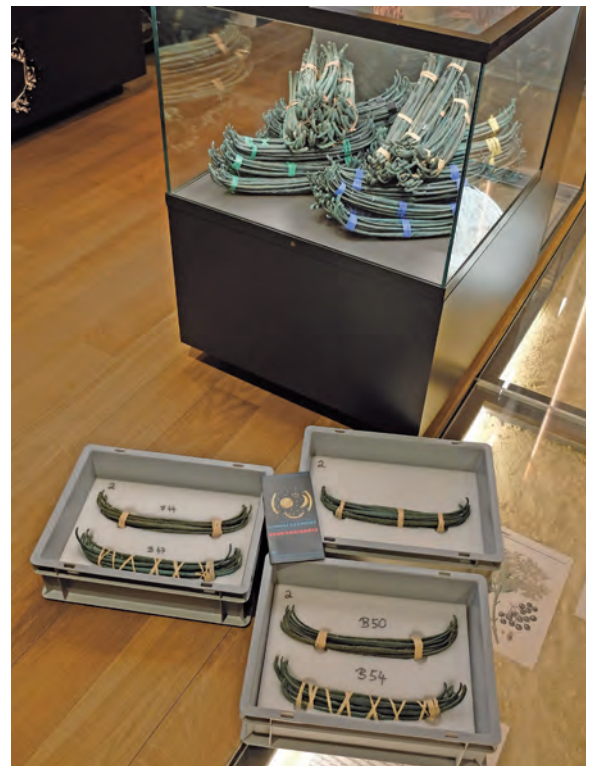
Fünf Barrenbündel mit je zehn Einzelbarren wurden an das Landesmuseum Halle ausgeliehen – mit den drei in Oberding nachgewiesenen Bastbündelungs-Varianten.

Der frühbronzezeitliche Spangenbarrenhort von Oberding besteht aus insgesamt 796 Einzelbarren und wiegt über 80 Kilogramm. Er gilt als umfangreichster Spangenbarrenhort Europas. 2014 wurde er im Zuge einer Ausgrabung in Oberding entdeckt und anschließend von der Stadt Erding für das Museum erworben. Im Rahmen eines von der Stadt finanzierten Forschungs-