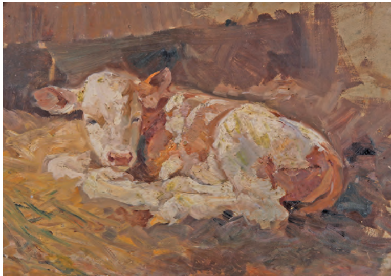
Franz Xaver Stahl ist bekannt für seine lebensechten Tierdarstellungen.

Architektur einzigartige Luftschutzkeller. Die erforderlichen Anmeldungen sind bis Samstag, 5. Juni, unter der Telefon-Nummer 0171/8095120 oder