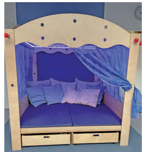
Das neue Podest.