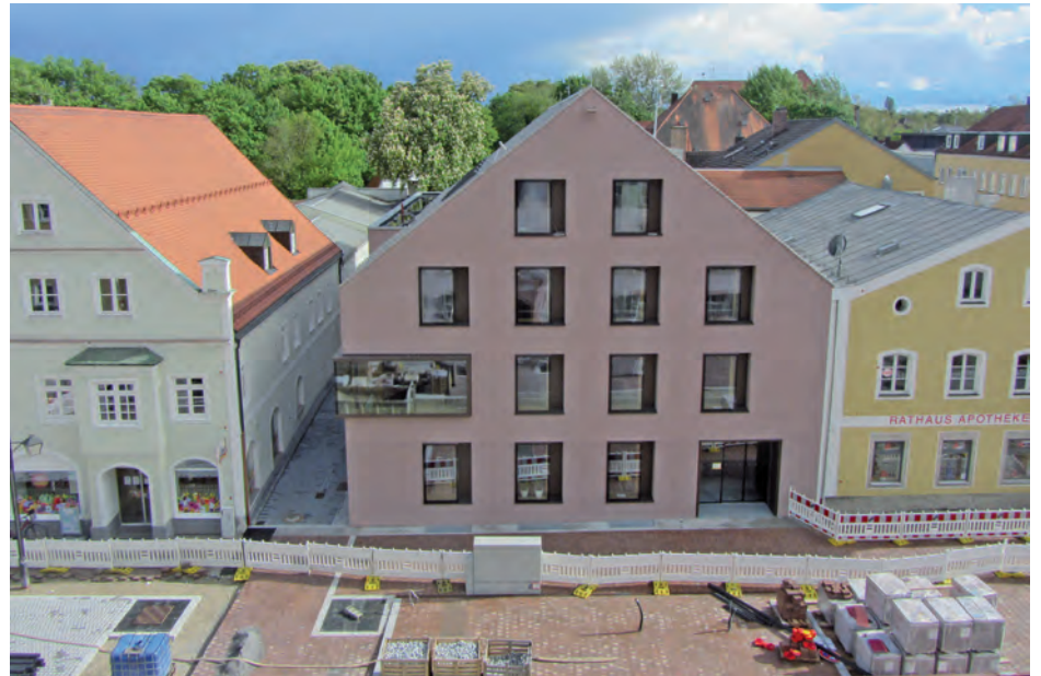
Obwohl die Stadt aufgrund der Corona-Pandemie Einbußen bei den Steuereinnahmen hinnehmen musste, setzte sie ihre Bauprojekte wie hier in der Landshuter Straße 4 planmäßig fort.