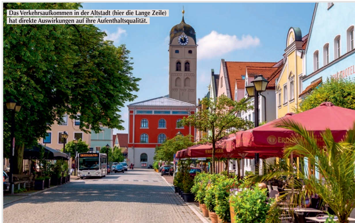
Das Verkehrsaufkommen in der Altstadt (hier die Lange Zeile) hat direkte Auswirkungen auf ihre Aufenthaltsqualität.