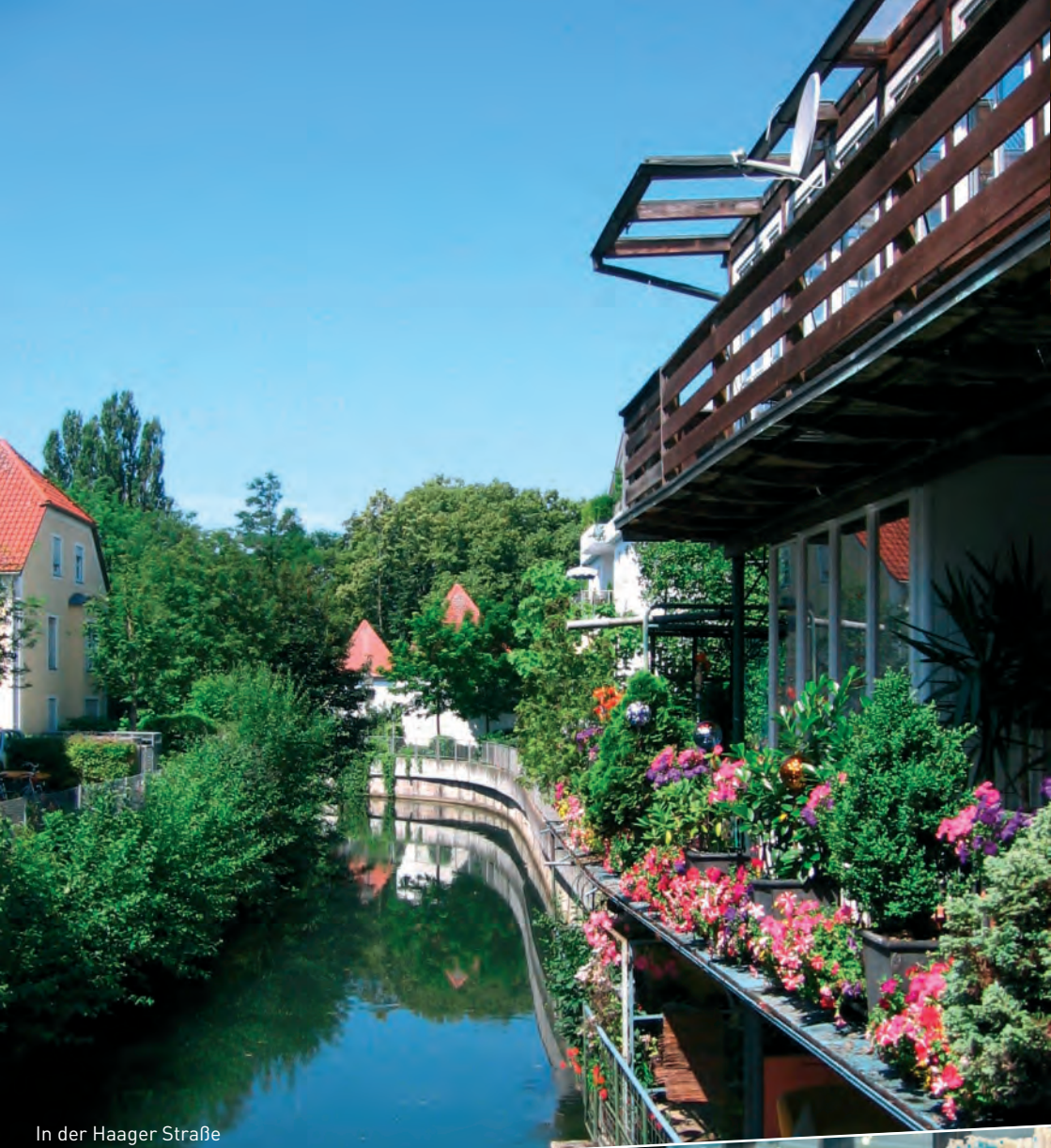
In der Haager Straße