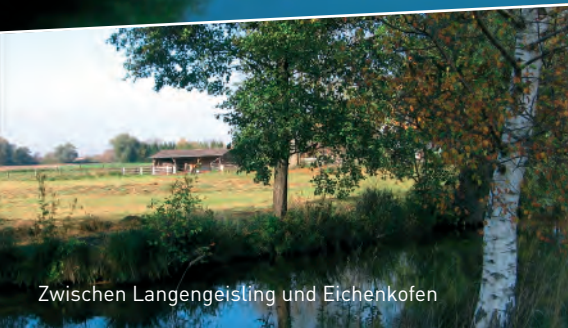
Zwischen Langengeisling und Eichenkofen