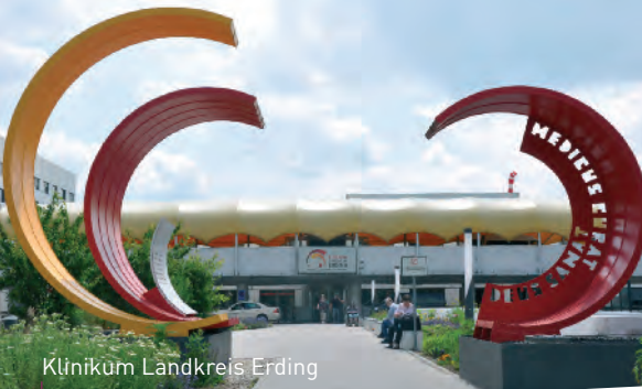
Klinikum Landkreis Erding