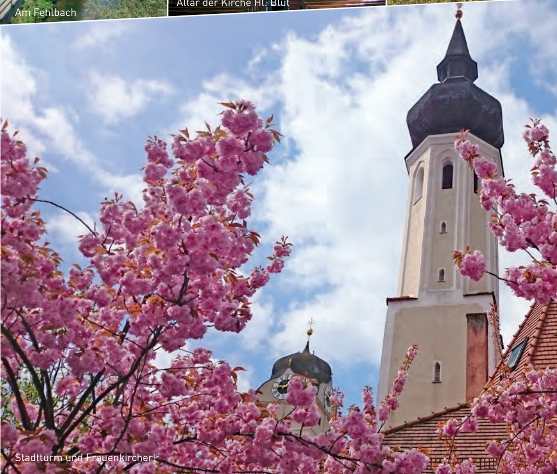
Stadtturm und Frauenkircherl