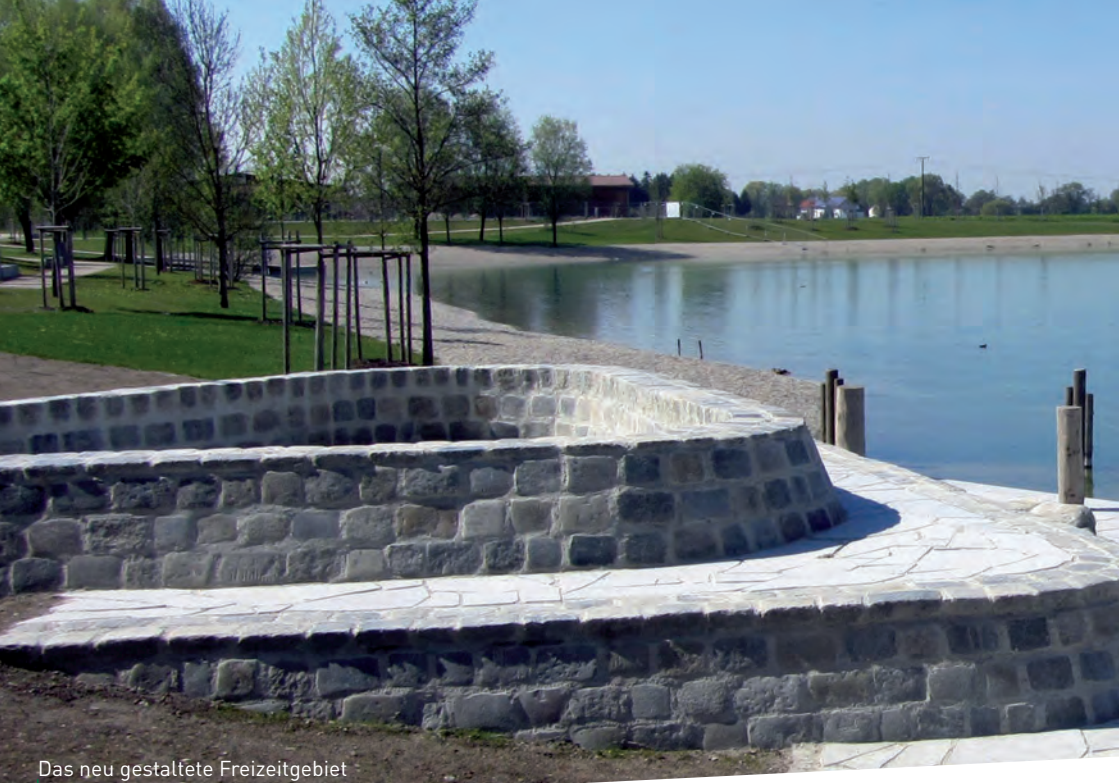
Das neu gestaltete Freizeitgebiet