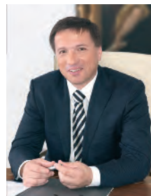
Max Gotz Oberbürgermeister

medizinische Versorgung, Betreuung und viele weitere Angebote für die ältere Generation bündelt. Besonders freue ich mich über die Kooperation mit dem VdK-Ortsverband, der wichtige Angaben zur Barrierefreiheit beisteuert. Sie machen die Zusammenstellung noch nützlicher und sind ein gutes Beispiel für die Art, wie wir den demographischen Wandel meistern können: Durch Zusammenarbeit und Solidarität.