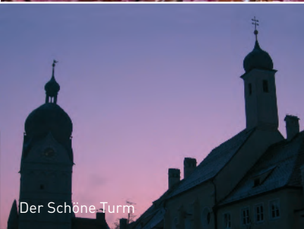
Der Schöne Turm