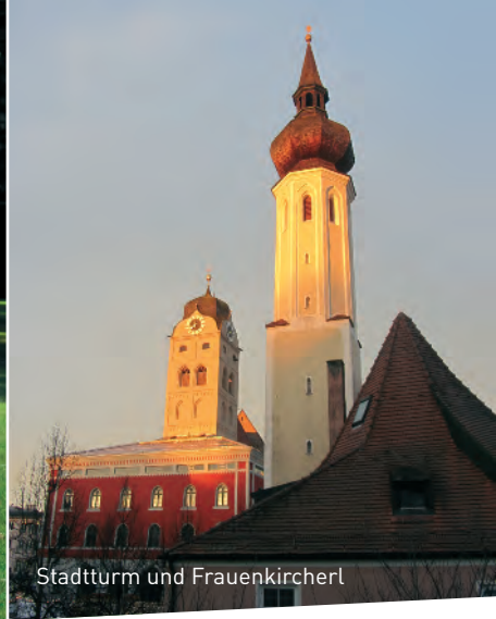
Stadtturm und Frauenkircherl